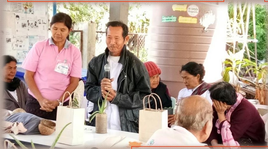
เสนอความต้องการ ตารางเรียน กิจกรรม