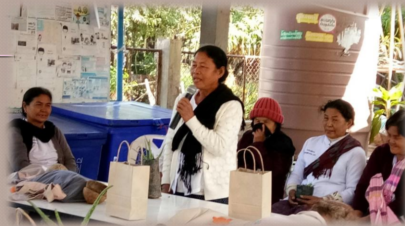
ทุกคนมีความเชื่อมั่น นำเสนอหน้าชั้นเรียน