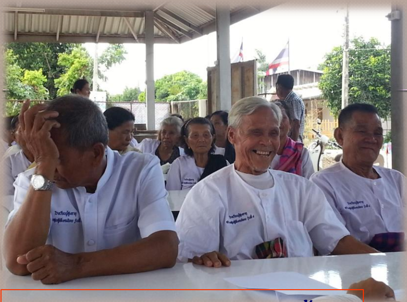
นักเรียนผู้สูงอายุชาย มากขึ้น